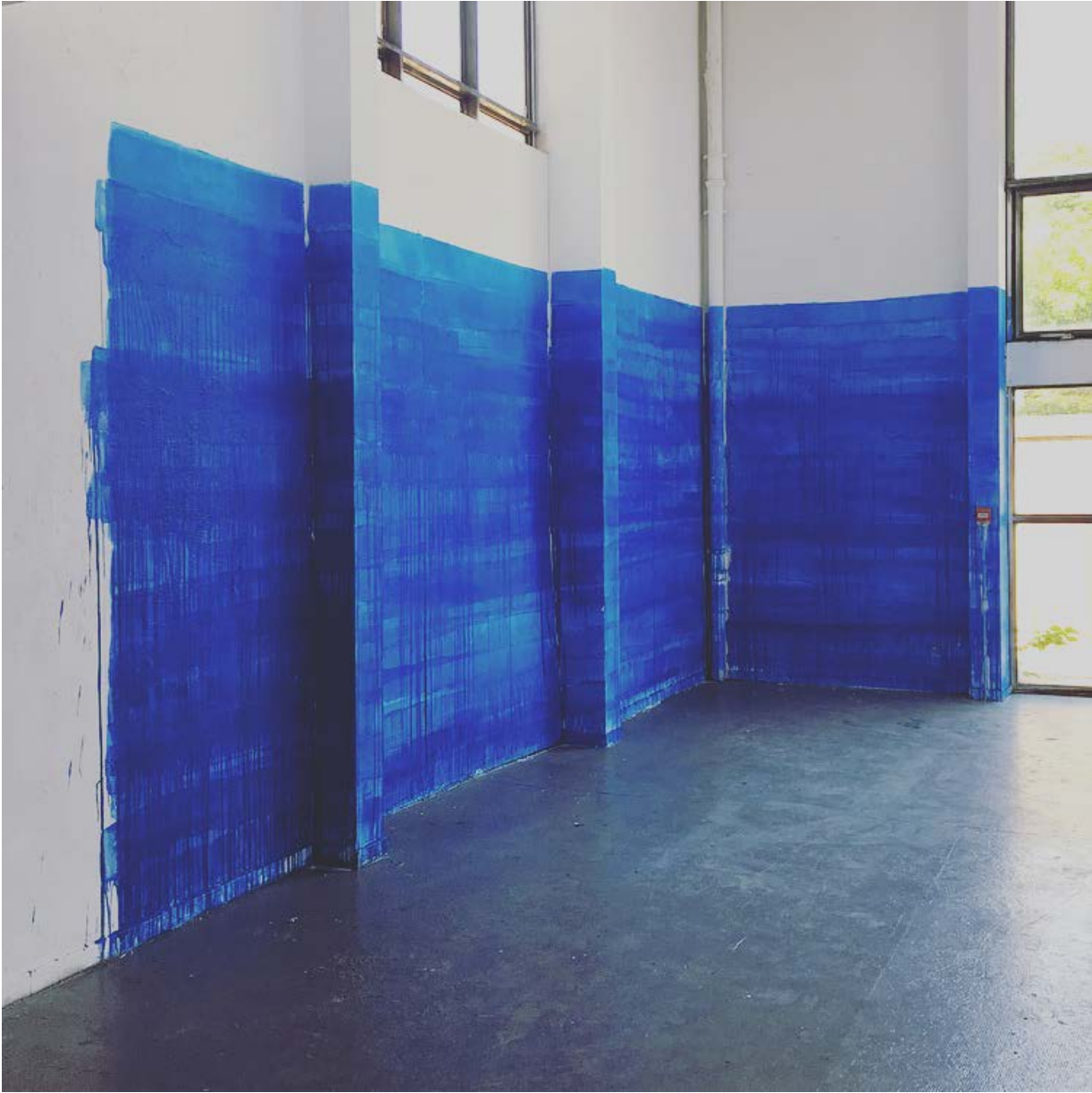
Apnée, Fabien Lamarque