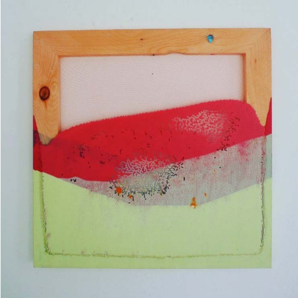
Fluo red numero 15, Fabien Lamarque